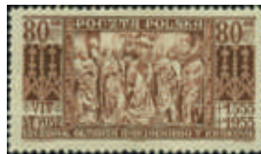
Twee details van het middenluik

We stappen de kathedraal binnen om er het prachtigste laatgotische altaar van Europa te bewonderen. In 1477 kwam de Neurenbergse kunstenaar Veit Stoss naar Krakau om er op bestelling van de stadsraad een altaarstuk uit hout te snijden. Hij werkte er twaalf jaar aan. Het werd een adembenemend drielukkig, dat in het midden Maria voorstelt, omgeven door de twaalf apostelen. Sommige figuren zijn drie meter hoog! Het linker- en het rechterluik bestaan telkens uit drie boven elkaar geplaatste panelen.