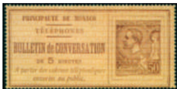
Gedrukt op veiligheidspapier met op de achtergrond de woorden POSTES ET TÉLÉGRAPHES TÉLÉPHONES. Boekdruk op hard ongegomd papier met tanding 13½ (Yvert nr. 1). Portret van prins Albert I, type van de postzegels van 1891.

In Monaco verscheen in 1886 één telefoonzegel met de tekst PRINCIPAUTÉ DE MONACO, gevolgd door BULLETIN DE CONVERSATION. Net als in Frankrijk diende zo'n telefoonbewijs voor een gesprek vanuit een openbare telefooncel, maar hier moest er wel 50 c. voor 5 minuten te worden betaald.